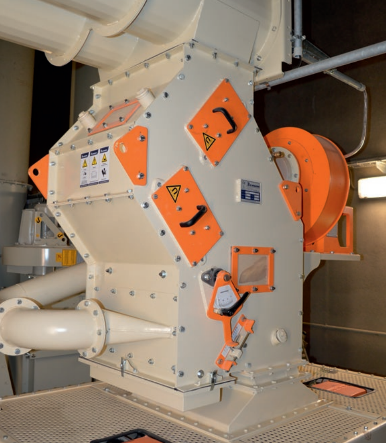
SGA 600 vor einer Strukturmühle | SGA 600 upstream of a structure mill