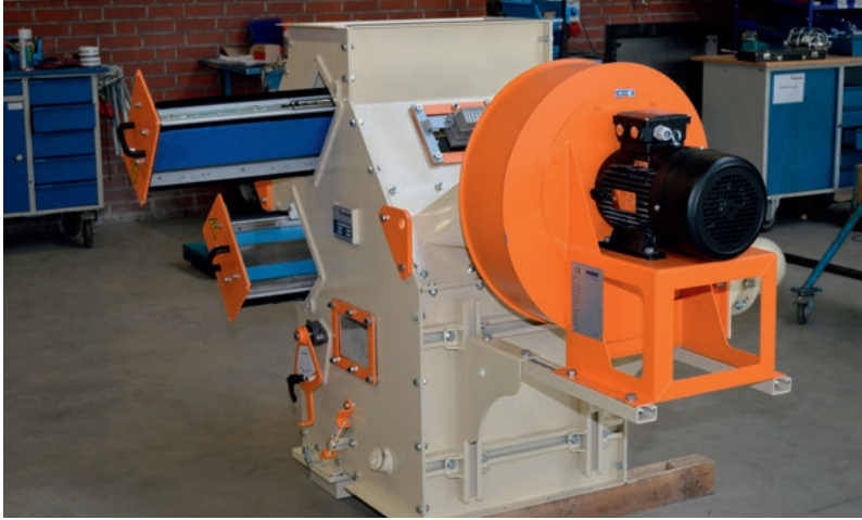
ATEX Ausführung | ATEX conform