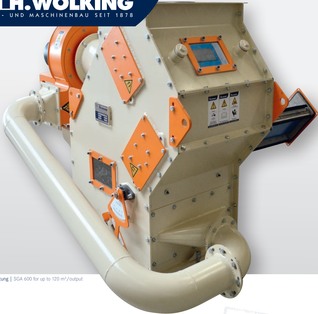
SGA 600 für bis zu 120 m 3 /Leistung | SGA 600 for up to 120 m 3 /output