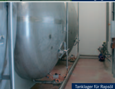
Tanklager für Rapsöl